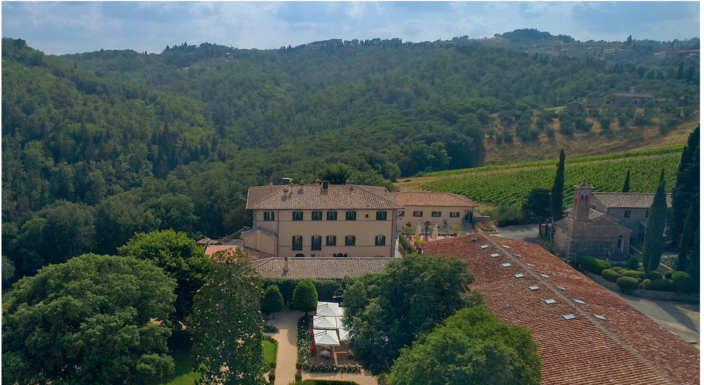
Villa mit Garten, Kellerei und Kapelle | Seite 1: Neue Betonfässer im Weinkeller