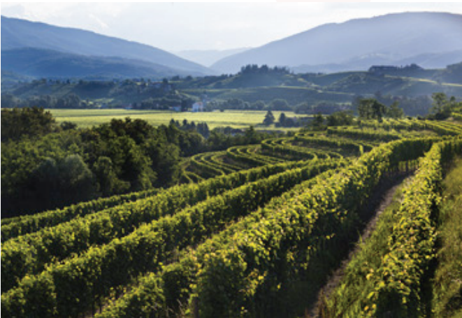
Blick über die Hügel von Spessa / Cividale del Friuli