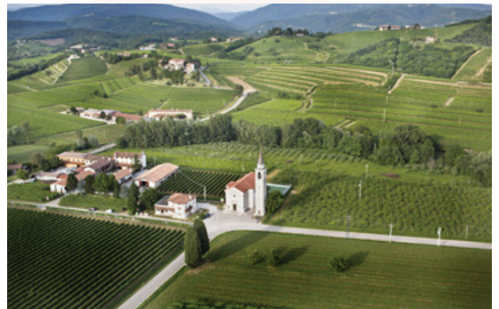
Luftaufnahme der Kirche von Spessa mit dem Weingut im Hintergrund

Dann kaufen sie ihren Weinvorrat für die nächste Woche oder gleich die nächsten zwei Monate. So machen es auf jeden Fall die vielen österreichischen Weinliebhaber, die sich einige Kisten Wein in den Kofferraum für den privaten Direktimport laden lassen.